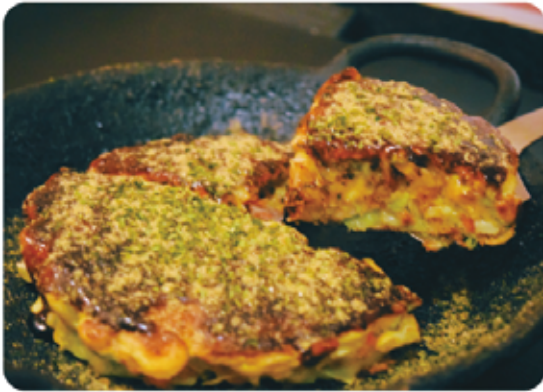
ふんわり生地とソースの風味がたまらない「お好み焼き（ぶた）」

客席は、カウンターとテーブル席があり、お客さま同士の距離も近いことから、初対面で交流が深まったり、新しい飲み仲間ができたり、なんと就職先が見付かったお客さまもいらっしまったとか・・・地域の方を中心に様々な出会い溢れるお店となっています。