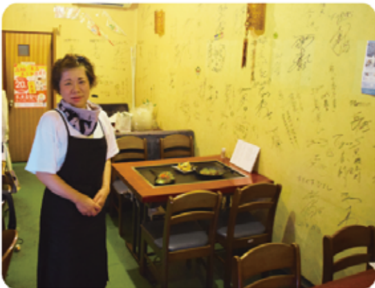
プロ野球選手たちのサインが並ぶ店内の壁面

また、当所の観光部会で、インバウンドに対応した飲食業の体制づくりについてご提議いただき、外国人観光客向け英語表記メニューの作成など、地域に貢献する事業について、観光部会メンバーと一緒に検討されています。