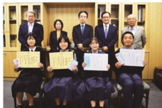
【受賞者一覧（敬称略）】

青色申告会は今後も、安芸税務署や各関係団体と協力し、〔税について関心を持つ、きっかけづくり〕に取り組んでまいります。