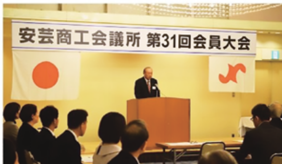
【令和6年度優良従業員表彰者】

会員の皆様をはじめ、多くのご来賓の方々にお越しいただき、誠にありがとうございました。今年は安芸商工会議所優良従業員表彰規則に基づき、2名の方が表彰されました。受賞されたお二人の益々のご活躍とご健勝をお祈り致しております。